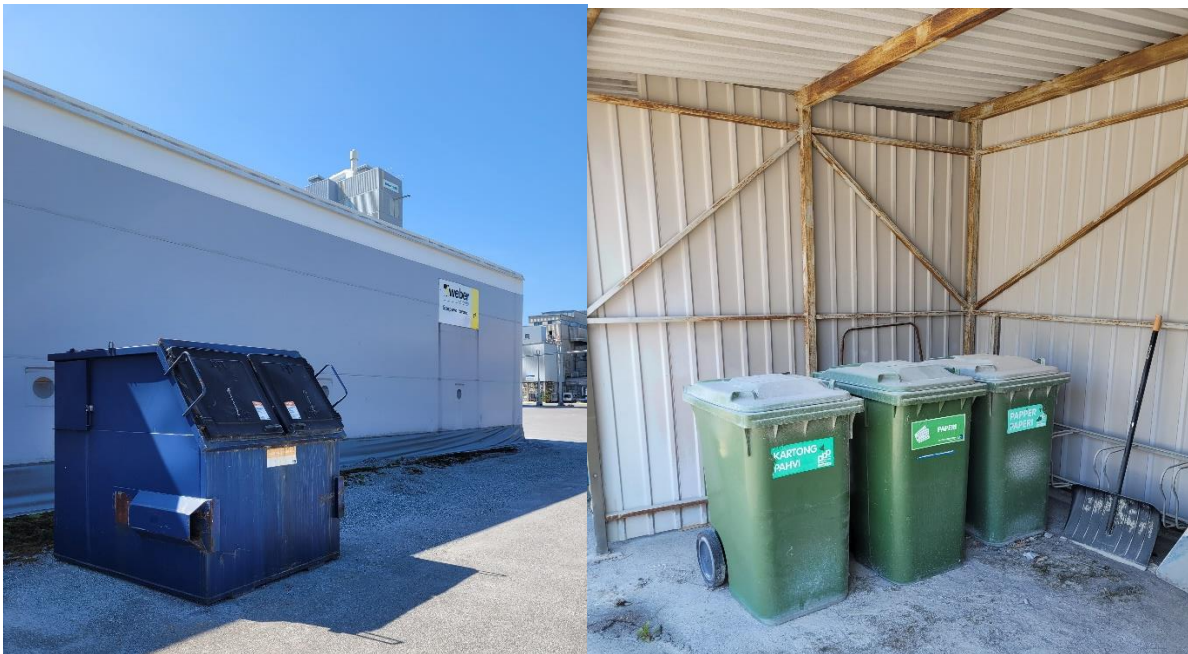
Kuva 2 Sekajäte (vasemmalla), sekä paperi ja pahviastiat (oikealla)

Metalliromua ovat mm. metalliputket ja -kaapelit, vaijerit, hanat, helat, vetimet, naulat, metalliastiat, huonekalujen metalliosat sekä metalliset koneet ja laitteet. Metallia vietään metallinkeräyspisteeseen (Kuva 3).