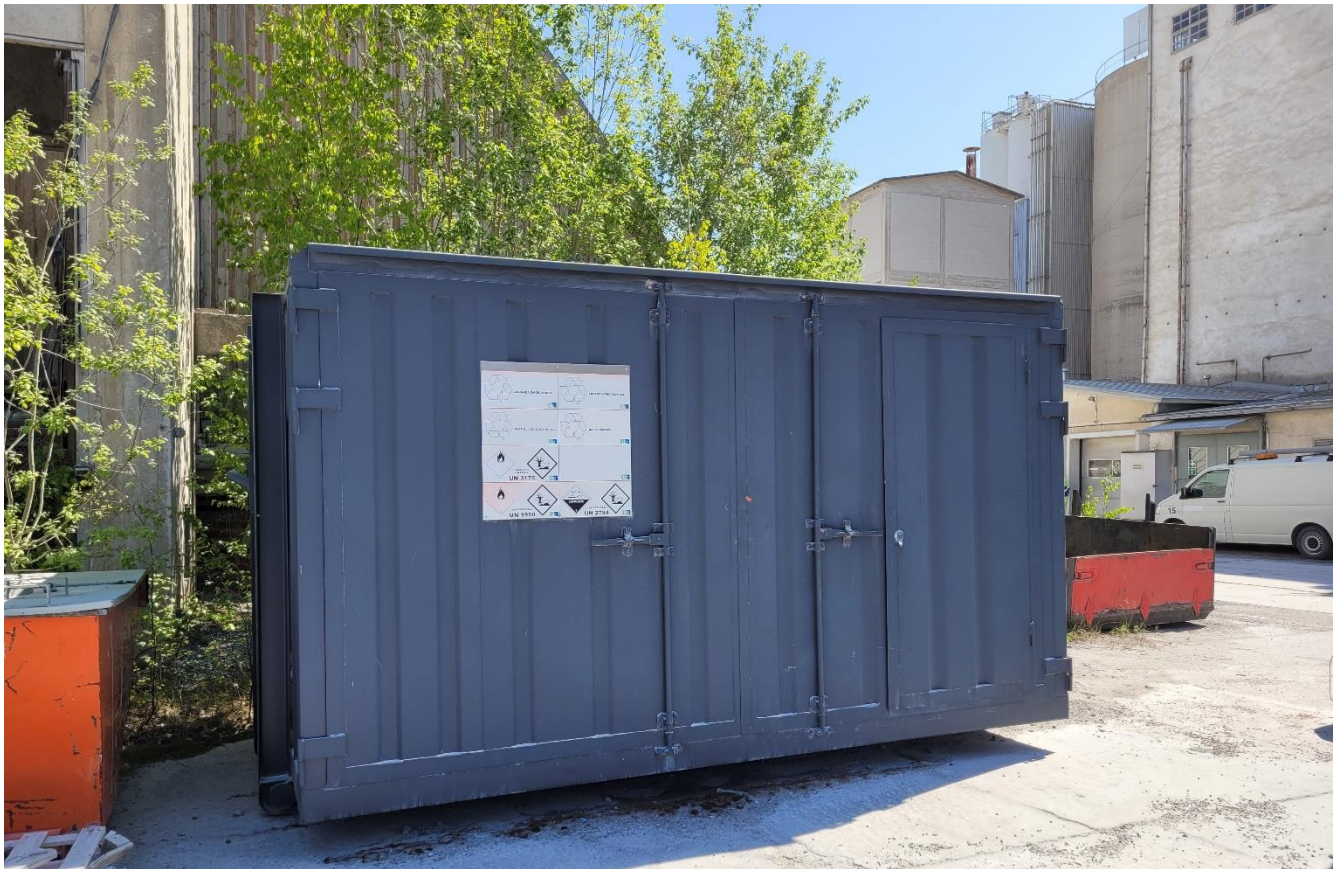
Kuva 4 Vaarallisen jätteen kontti

Jos alus haluaa toimittaa suuria määriä vaarallista jätettä satamaan, sen täytyy tehdä ilmoitus vaarallisen jätteen lajista ja määrästä vähintään 24 tuntia ennen saapumista. Laiva-asiamies välittää aluksen tilauksen jätehuoltoyritykselle ja laskuttaa alusta syntyneiden kustannusten perusteella.