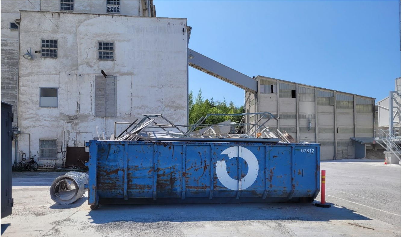
Kuva 3 Metallijätteen lava